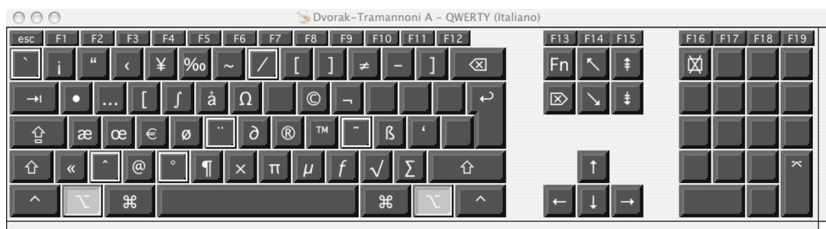
Opzione (Alt). La cornice doppia rivela i tasti modificatori.